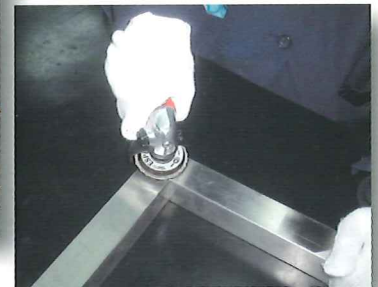
溶接後の仕上げ作業に