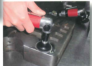
金型の仕上げ作業に