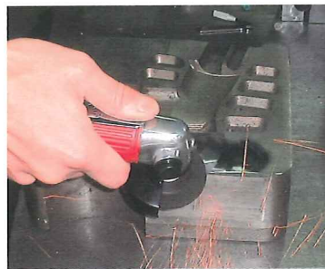
金型の仕上り作業に