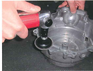
鋳造品のバリ取り作業に