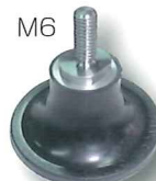
ワンタッチパット (φ50)